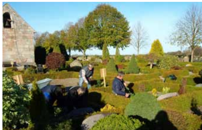
Motiv fra grandækningskursus på Rørbæk kirkegård efteråret 2010

Man kan sagtens beholde gravstedet udover fredningstiden, hvis man ønsker det. Så skal der bare laves en ny aftale om, hvem der sørger for vedligeholdelsen.